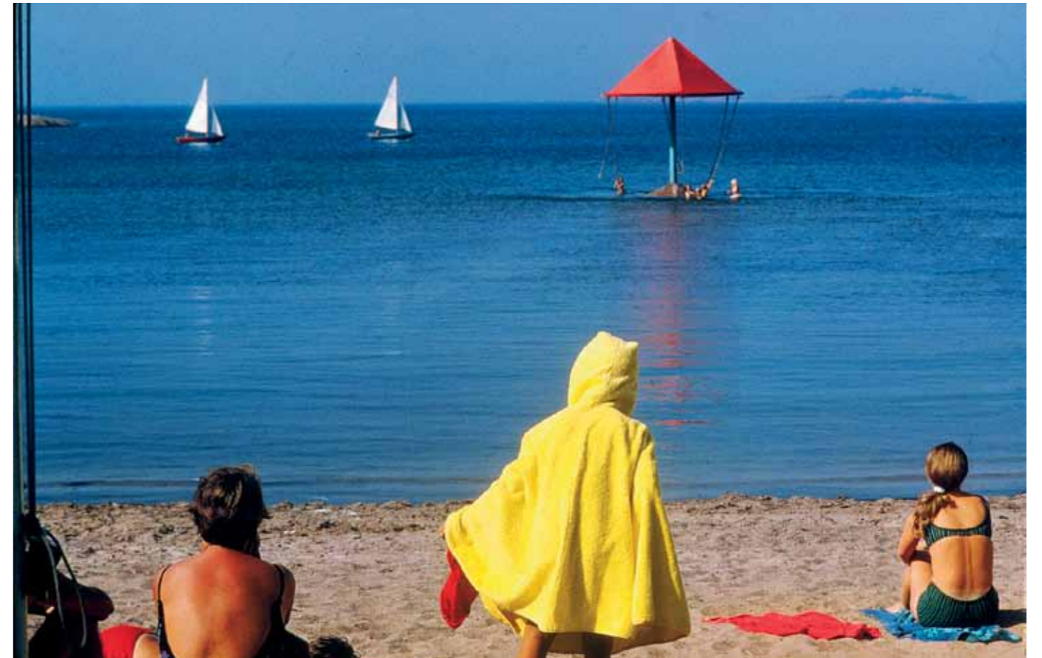
Etelä-Suomen kesäistä idylliä ajalta, jolloin sään ääri-ilmiöistä ei ollut tietoaakaan.

Syksyinen aurinko kimmeltää kuninkaanlinnan ikkunoihin Tukholmassa. Vastapäisellä rannalla, hotellin ikkunapöydässä, istuu pirteän punatukkainen rouva ja syö kermaista kukkakaalikeittoa lohitarilla.